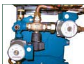
Kit hidráulico SRX2