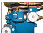
Kit hidráulico SRX1