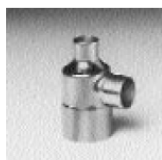
Art. 5130 R "T" reducida H-H-H