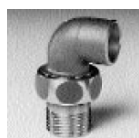
Art. 98 g Cu