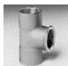
Art. 130 g Cu