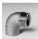
Art.92 g Cu