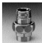
Art. 341 g Cu