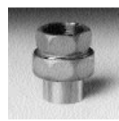
Art. 340 g Cu