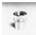
Art. 270 g Cu