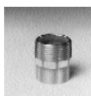
Art. 243 g Cu