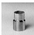
Art. 5243 Manguito de reducción M-H