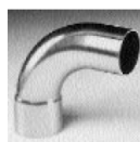
Art. 5001 A Curva 90° M-H

Curva M-H 10 mm Curva M-H 12 mm Curva M-H 15 mm Curva M-H 18 mm Curva M-H 22mm Curva M-H 28 mm Curva M-H 35 mm Curva M-H 42 mm Curva M-H 54 mm